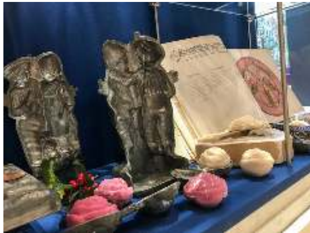
IJsvormen en het standaardwerk Praktische Konditorei-Kunst uit 1921 uit het Ruijs-archief.