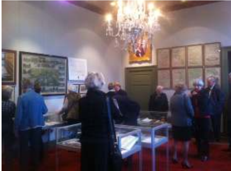
Het Historisch Kabinet in Slot Zeist,

Tenslotte zij vermeld dat de Stichting sinds 2014 aan het Zeister Historisch Genootschap archivalia in bruikleen heeft gegeven ter expositie in het Historisch Kabinet van Slot Zeist.