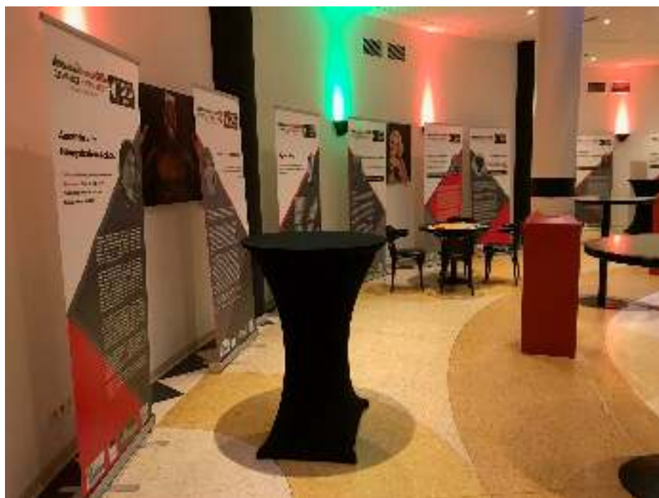
Een deel van de expositie Markante Zeister Vrouwen