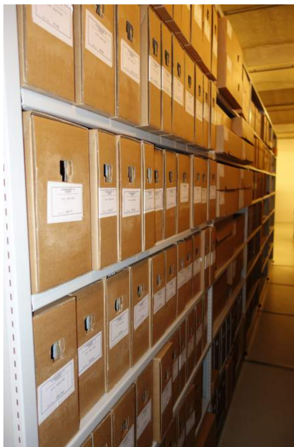
De archiefdozen van de Stichting Ruijs Archief in de kluizen van het gemeentearchief van Zeist.